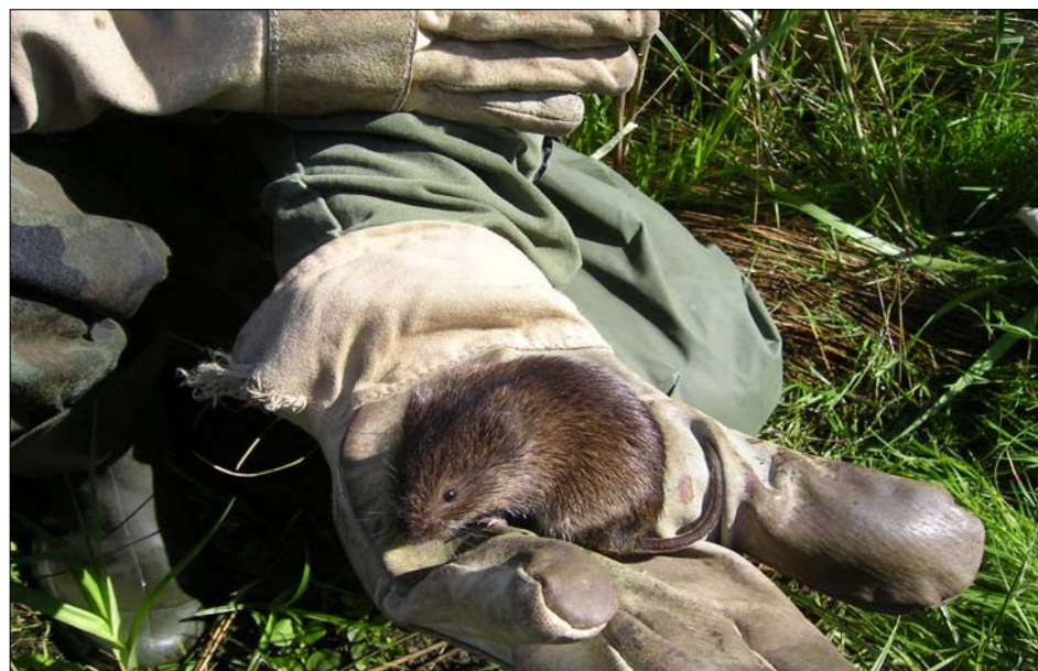
2. ábra: Északi pocok